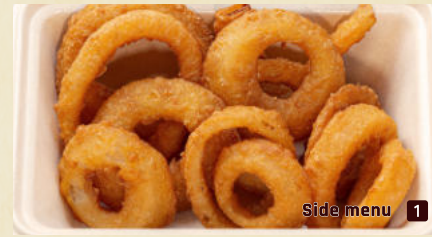
Side menu 1