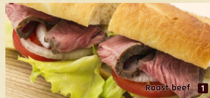
Roast beef 1