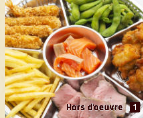
Hors d'oeuvre 1