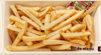
Side menu 2