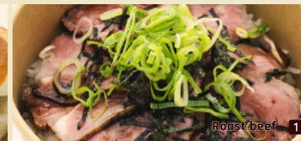
Roast beef 1