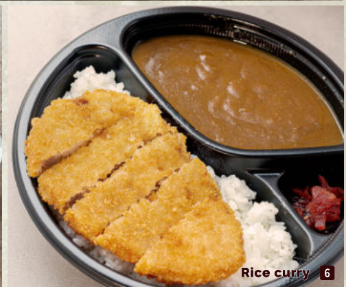
Rice curry 6