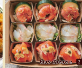
Hors d'oeuvre 2