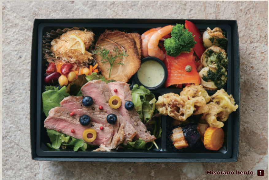
Misorano bento 1