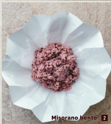
Misorano bento 2