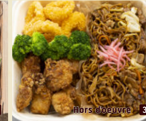
Hors d'oeuvre 3